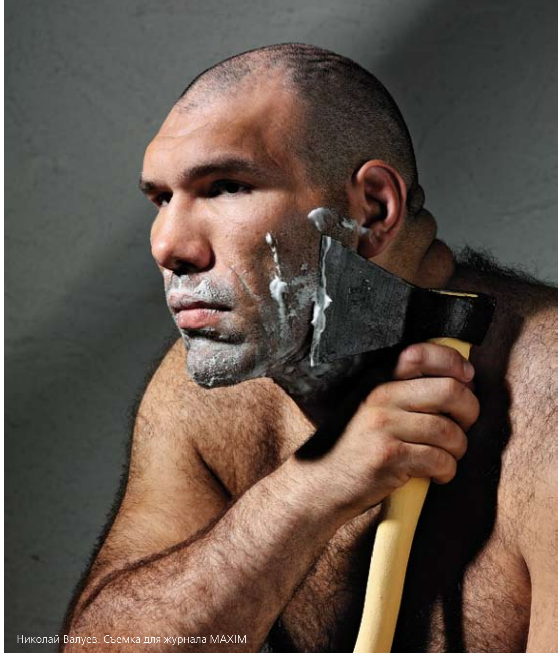
Николай Валуев. Съемка для журнала MAXIM