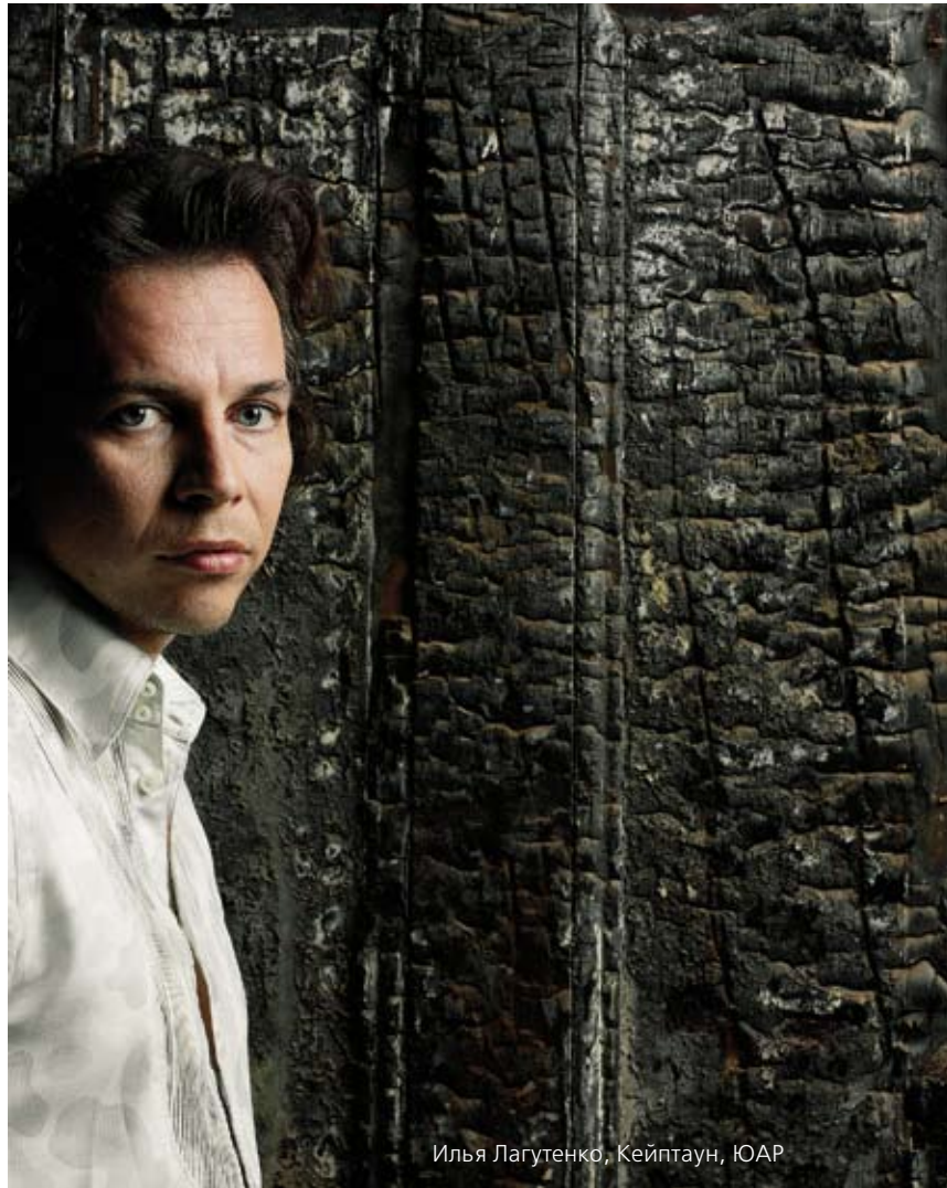
Илья Лагутенко, Кейптаун, ЮАР