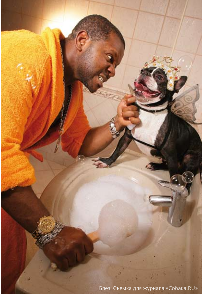
Блез. Съемка для журнала «Собака.RU»