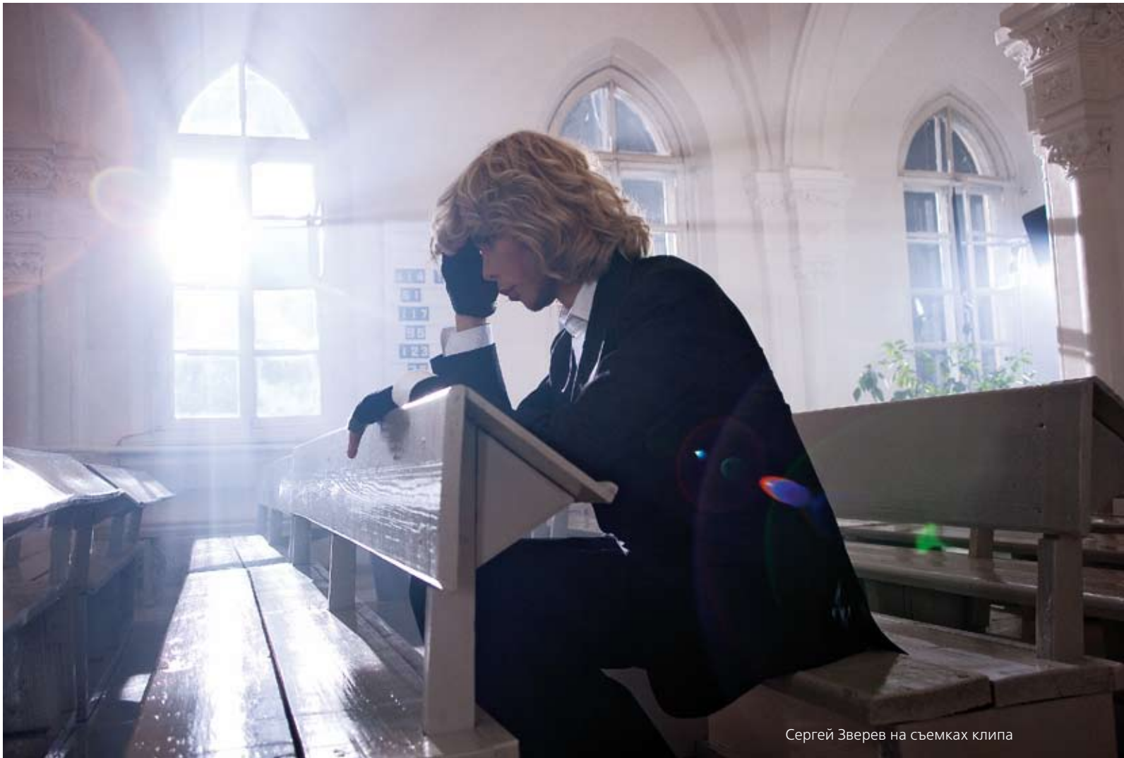
Сергей Зверев на съемках клипа

Беркову в образе Королевы. Она ведь настоящая королева секса. Обнаженная девушка должна выглядеть как леди. Или Ксения Собчак. У нее есть давно проверенные, отточенные позы. Она приходит на съемку и сразу их принимает. Вообще есть несколько красивых, испытанных поз, которые нравятся мужчинам, даже придумывать ничего не надо. Я говорю: «Ксения, а теперь давайте попробуем что-нибудь другое». И она соглашается, а потом смотрит на результат и говорит: «Да, продолжайте, у вас хорошо получается». В общем, мы сотрудничаем.