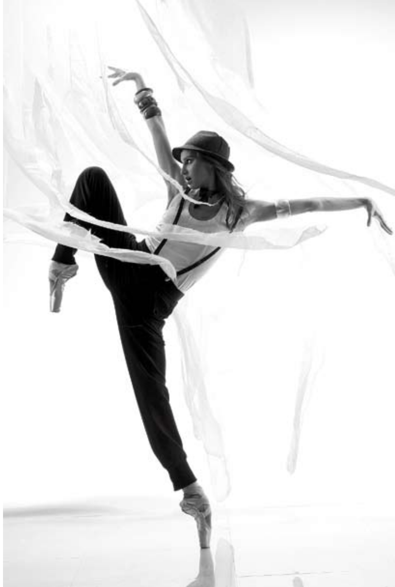
Три работы для выставки «Молодые звезды» в Мариинском театре (Санкт-Петербург)