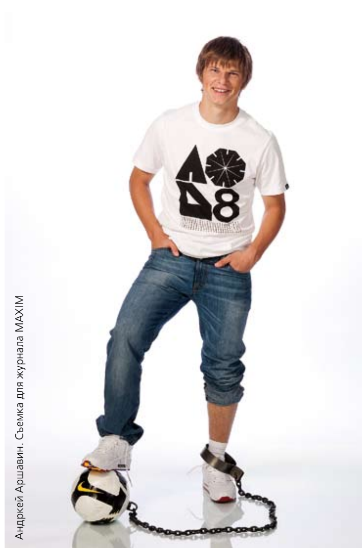
Андрей Аршавин. Съемка для журнала MAXIM