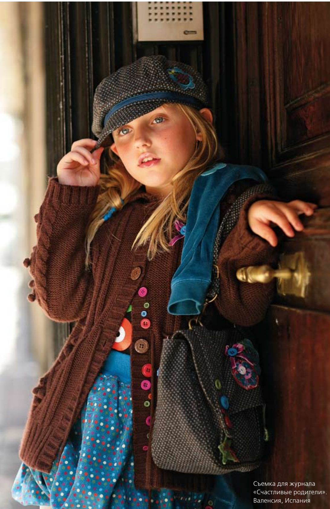
Съемка для журнала «Счастливые родители». Валенсия, Испания

Конечно, интереснее всего фотографировать людей, но вообще я снимаю все. И это тенденция, причем очень правильная.